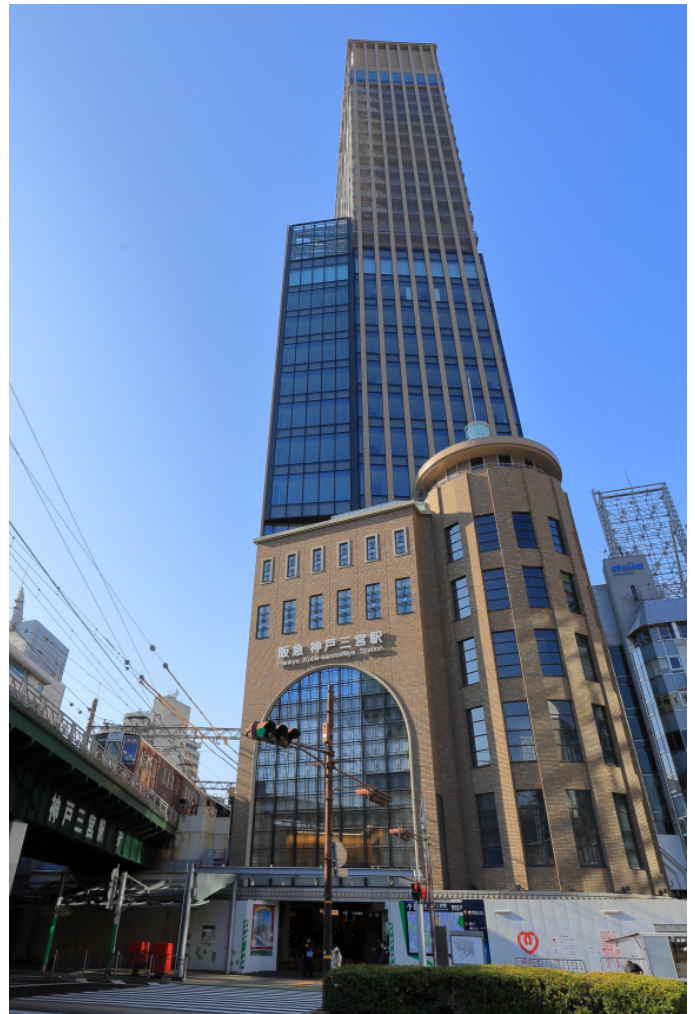
4月26日の開業に向けて 建設中の「神戸三宮阪急ビル」